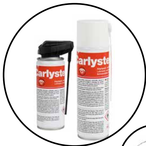
Tube prolongateur flexible pour aérosol