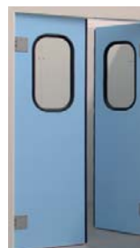
Porte va et vient

Option : pour portes en tôle laquée, vantail de couleur selon nuancier.