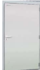
Porte de service